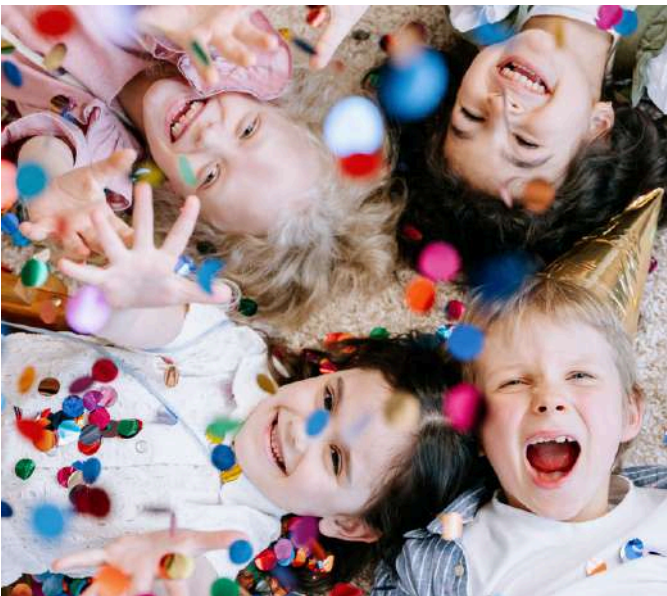
13-15 MEI KINDER PINKSTER