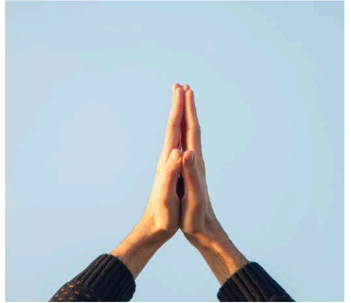
12-19 MEI PINKSTER