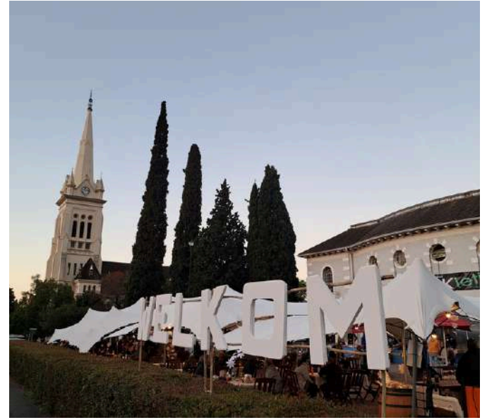
30-31 AUG MARKIETIE!